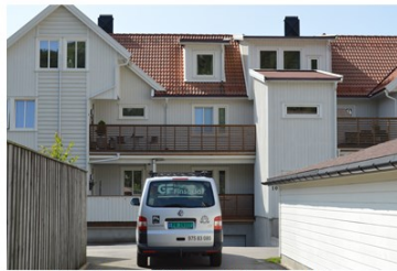
Sogndalsveien 103, komplett levert fra GF